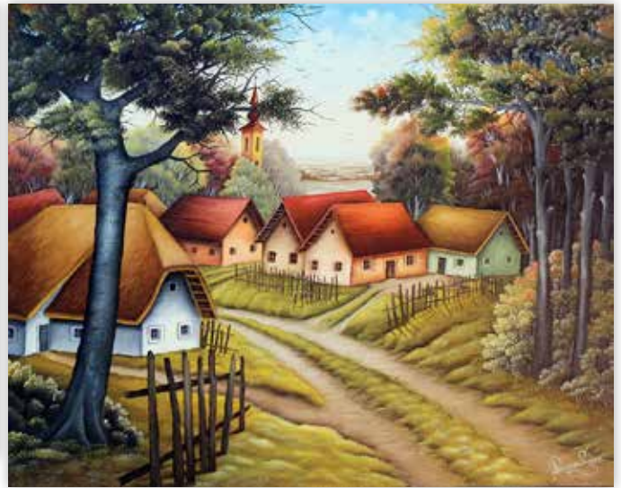
Stjepan Pongrac - Jesen u selu, 2014.