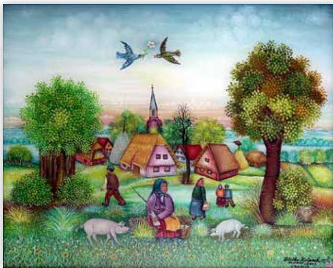
Zlatko Kolarek - Na paši, 2015.