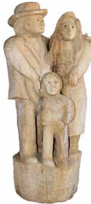
Zvonimir Dangubić Obitelj, 2015.