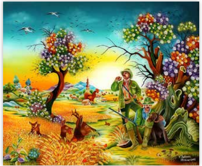
Vladimir Dolenc - Na odmoru, 2015.