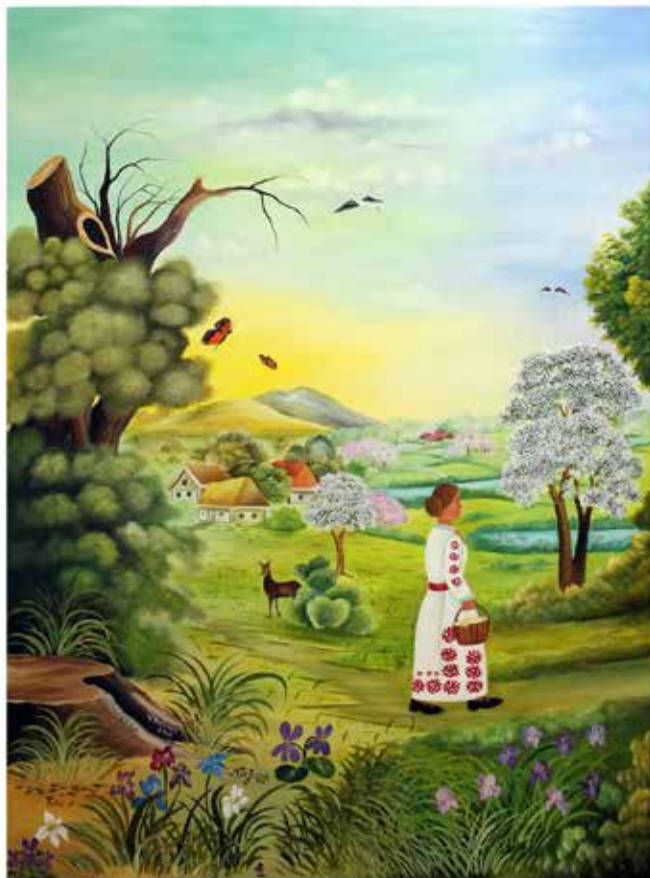
Proljeće - 2700x2000mm