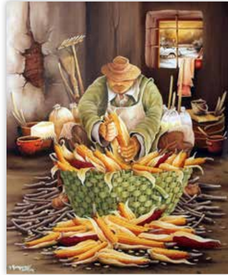
Josip Gregurić - Zimska idila, 2015.