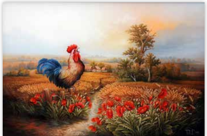
Denic Toth - Pevac u žitnom polju, 2015.