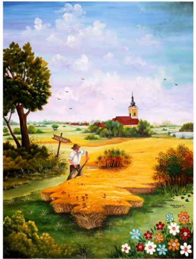
Ljeto - 2700x2000mm