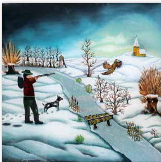
Mirjana Lujčić - Lovac, 2015.