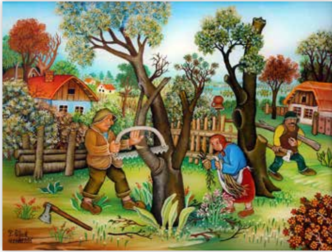
Franjo Poljak - Rezanje suhih grana, 2015.