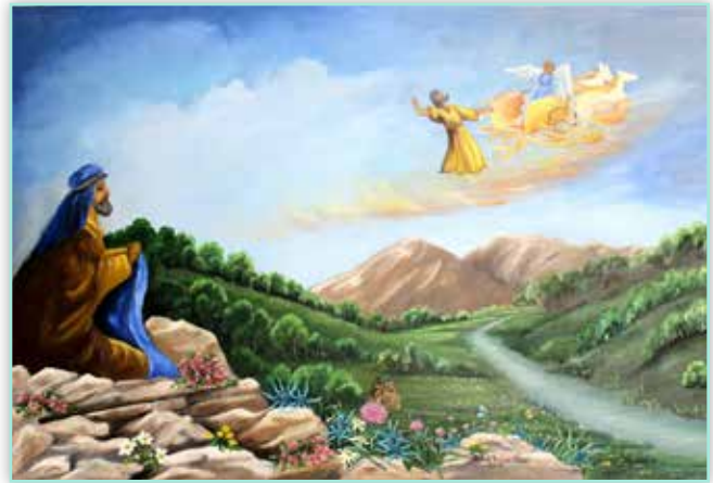
Radmila Bošnjak Kolarek - Sveti Ilija, 2015.