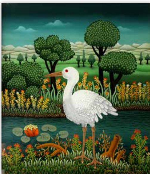
Josip Generalić - Roda, 2000.