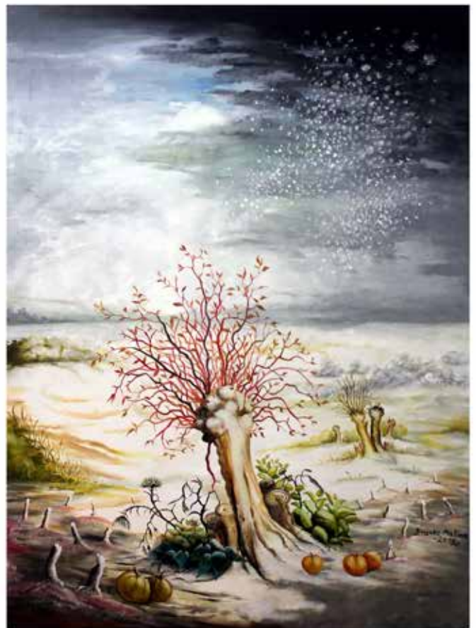
Zima - 2700x2000mm