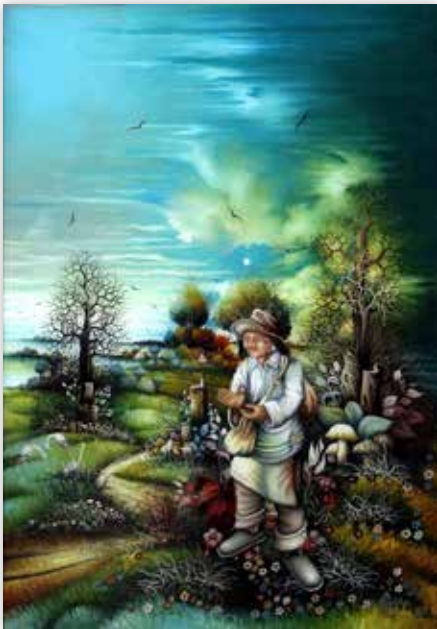
Đuro Jaković - Berač gljiva, 2014./2015.