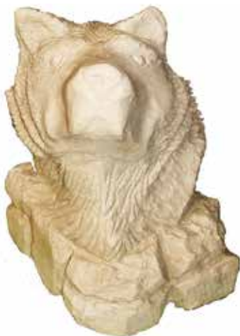
Dražen Kuharović Glava vuka, 2015.