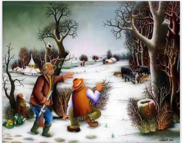
Zlatko Štrfiček - Lovci, 2015.