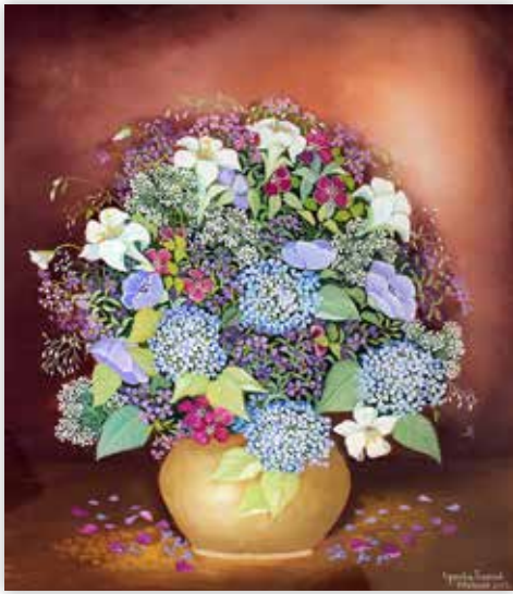
Ljerka Tropšek - Cvijeće, 2015.