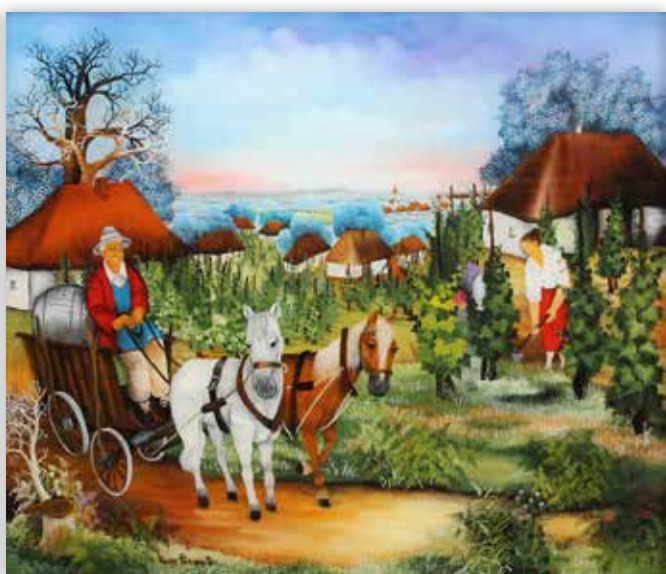
Nada Pakasin Petrić - Proljeće, 2015.