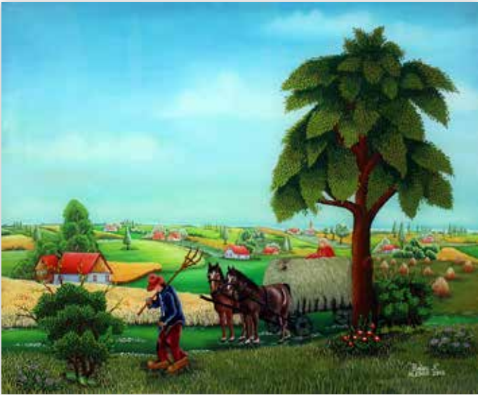
Nadica Belec - Spremanje sijena, 2015