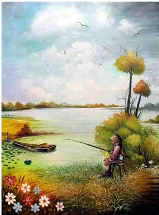
Jesen - 2700x2000mm